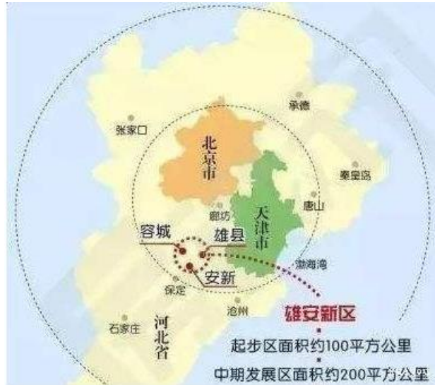
图 3：雄安新区起步区及中期发展区规划图

根据中央政府的规划定位，雄安新区将建成国际一流、绿色、现代的绿色智慧城市，需要谋划事关经济社会发展全局、带动力强的重大项目，实施“千亿绿色智慧城市”、“千亿旅游大健康”、“千亿先进制造业”、“千亿绿色交通”、“千亿新能源”和“千亿基础设施”等千亿乃至万亿工程，在经济基础薄弱的背景下，要满足以上巨大的融资需求，对于雄安新区未来的绿色金融发展来说，既是挑战，同时也意味着难得的发展机遇。